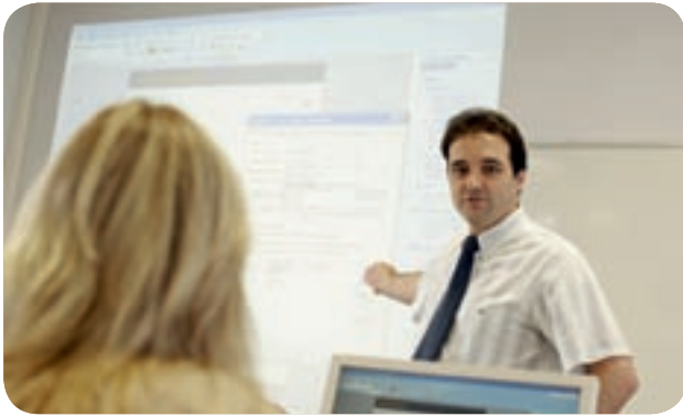
Des formateurs expérimentés et certifiés dans leur domaine

En ce début d'année, le TTI propose de vous faire découvrir ces nouvelles solutions et leurs formidables possibilités.