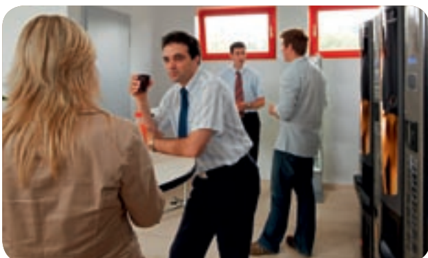
Restauration et rafraîchissements compris dans le programme formation