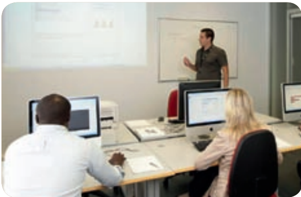
Des locaux modernes à la pointe et en conformité avec les exigences des éditeurs d'applications